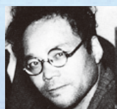
棟方 志功 (むなかた しごう) (1903～1975) 版画家・画家 「十和田奥入瀬」「十和田湖の柵」