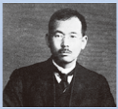
斎藤 茂吉 (さいとう もきち) (1882～1953) 歌人「ともしび」「白き山」