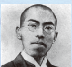
大塚 甲山 (おつか こうざん) (1880～1911) 詩人・俳人・歌人「十和田紀行」