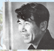
吉川 英治 (よしかわ えいじ) (1892～1962) 小説家「鳴門秘帳」「宮本武蔵」