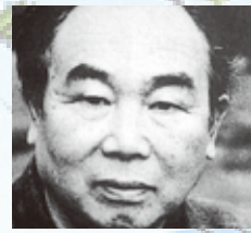
新田 次郎 (にった じろう) (1912～1980) 小説家「八甲田山死の彷徨」