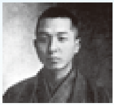
長塚 節 (ながつか たかし) (1879～1915) 歌人・小説家「土」