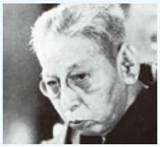
佐藤 春夫 (さとう はるお) (1892～1964) 詩人・小説家「湖畔の乙女」