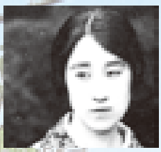
九条 武子 (くじょう たけこ) (1887～1928) 歌人「無憂華」「金鈴」