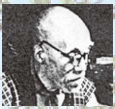
高村 光太郎 (たかむら こうたろう) (1883～1956) 詩人・彫刻家 「乙女の像」「智恵子抄」