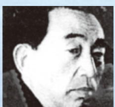
石坂 洋次郎 (いしがや ようじろう) (1900～1986) 小説家「青い山脈」「若い人」