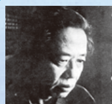
松本 清張 (まつもと せいちょう) (1909～1992) 小説家 「白い闇」「点と線」