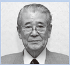
平山 郁夫 (ひらやま いくお) (1930～2009) 画家「奥入瀬」「シルクロード」