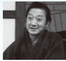
三浦 哲郎 (みうら てつお) (1931～) 小説家 「宇樽部の鯉」「水の中の神話」