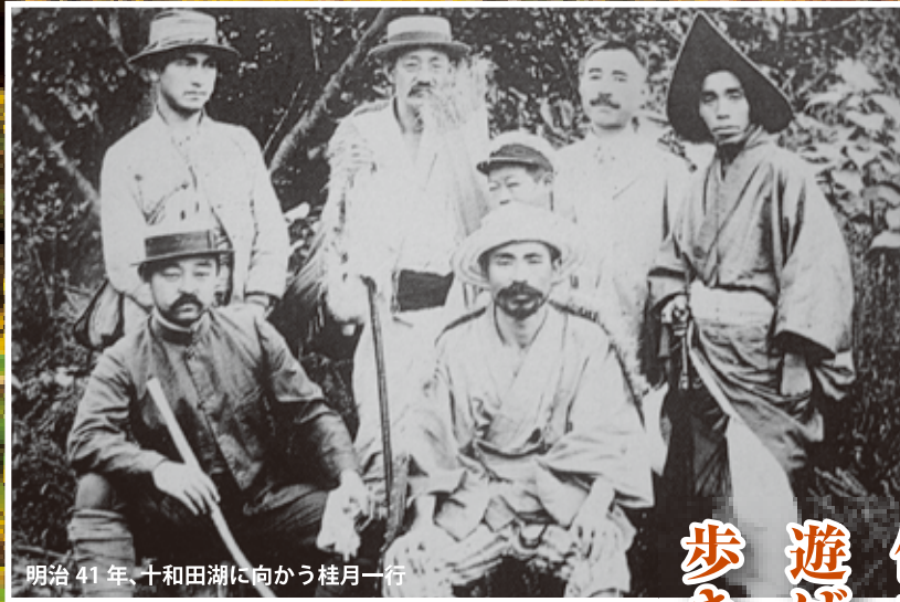
明治41年、十和田湖に向かう桂月一行