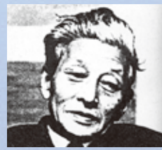
小林 秀雄 (こばやし ひでお) (1902～1983) 評論家