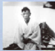
泉 鏡花 (いずみ きょうか) (1873～1939) 小説家「日本八景」選定「高野聖」